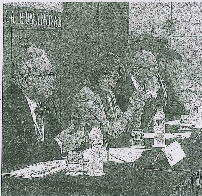
Una reunión del Colegio Territorial de Administradores de Fincas.