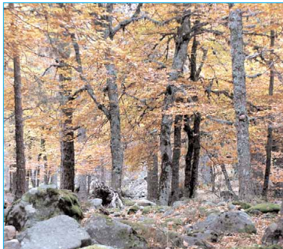
Hayedo de Barriomartín

Les proponemos un recorrido que, partiendo de la capital en dirección norte, por la Nacional 111, nos lleve hasta la localidad de Almarza desde donde parte por la derecha la estrecha carretera que, en pocos kilómetros nos deja en Gallinero. Pueblo con una enorme iglesia y con un abrevadero o pilón en el lado izquierdo de la travesía que marca el punto de partida para un camino que nos va a acercar, tras cruzar una valla ganadera que dejaremos cerrada a nuestra espalda, hasta el hayedo de Barriomartín. Les sugiero que caminen por sus frondas, que disfruten de esa luz casi mágica que filtran las hojas cuyos colores varían desde el dorado al rojo en contraste con el verde oscuro de los acebos que ya lucen sus característicos frutos rojos y que aparecen salteados en este singular paisaje. Si avanzan algunos cientos de metros por el camino que atraviesa el bosque podrán ver una construcción cilíndrica de lajas de piedra con una abertura superior que no es sino una cabaña de pastores. Otra similar se puede ver, no lejos de allí, en el acebal de Garagüeta.