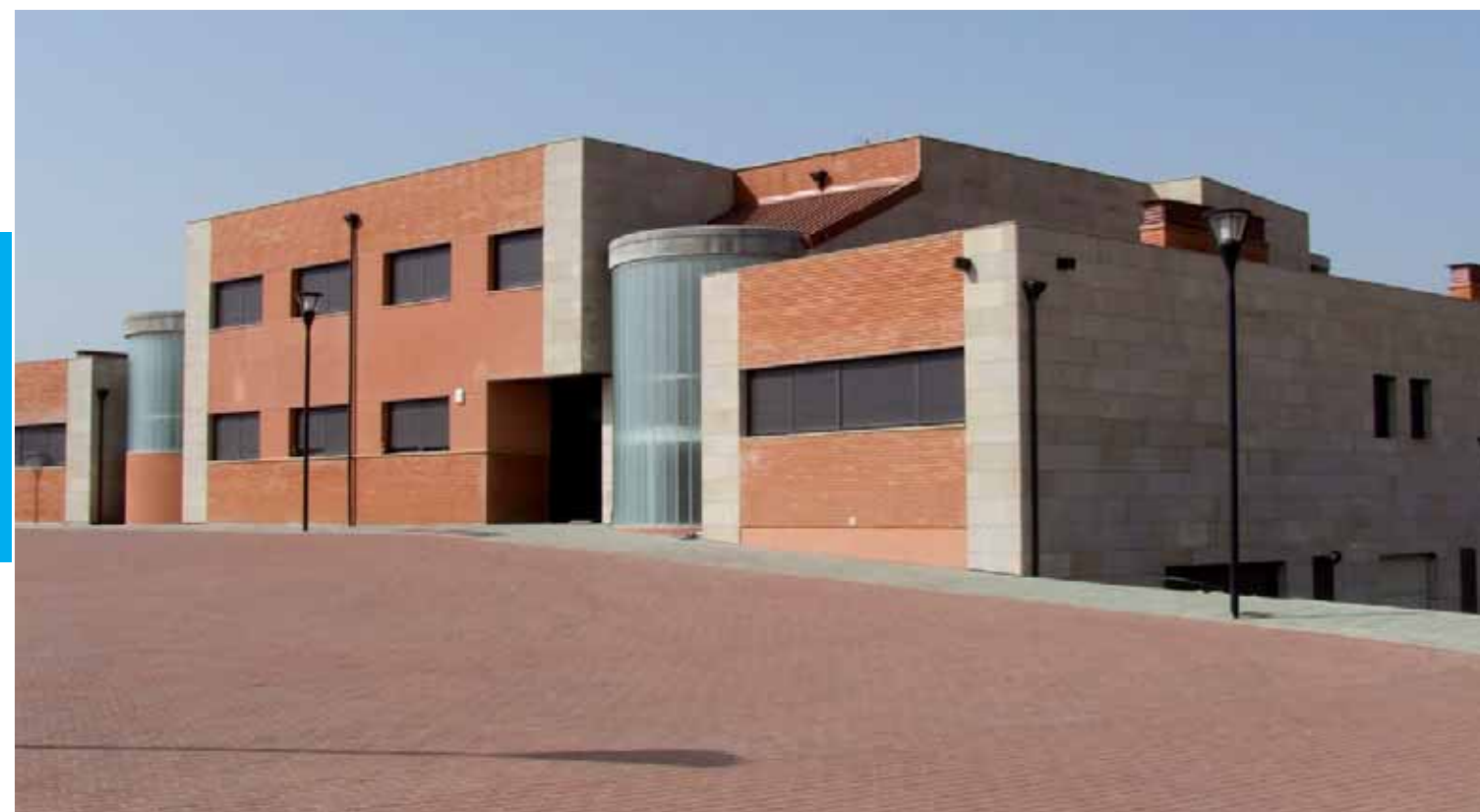
Sede del Centro Nacional de Investigación de la Calidad de los Alimentos de Soria

La hostelería soriana y en concreto la cocina y sus fogones van a ser una parte muy activa en el desarrollo del Centro. No olvidemos que lo que en el Centro de Calidad de los Alimentos se va a estudiar, son precisamente los alimentos. Al igual que precisará de un Centro Hospitalario de referencia para el estudio de muchos parámetros bioquímicos, microbiológicos, histológicos, etc..., será imprescindible contar –también- con la valoración y validación de los resultados de transformación de los alimentos en productos de consumo. Al igual que el 'mejor medicamento es un buen alimento', el mejor laboratorio de un alimento es la cocina. Y será indis-