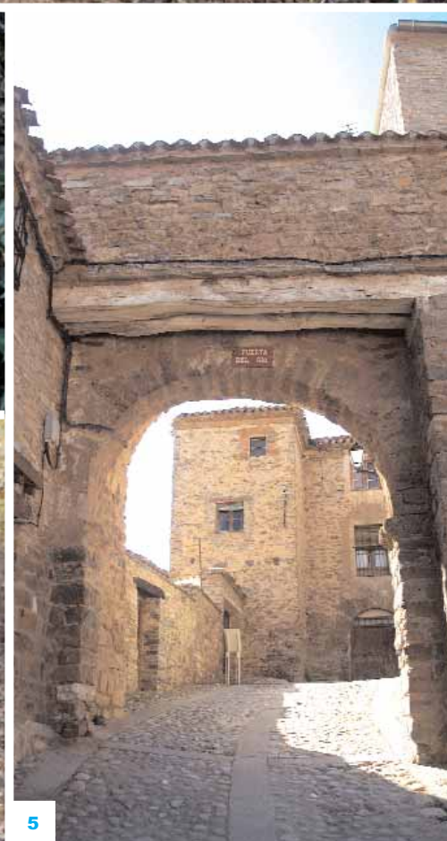
1 BRETÚN. 2 HAYEDO, DIUSTES. 3 HAYEDO, BARRIOMARTÍN. 4 CASTILLO DE YANGÜAS. 5 SANTA CRUZ DE YANGÜAS. 6 PUERTA DEL RÍO SANTA CRUZ DE YANGÜAS.