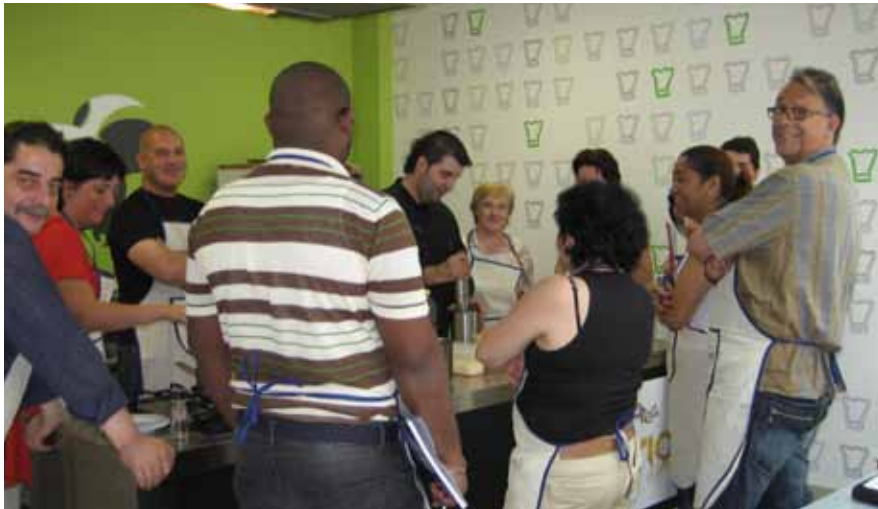
Curso desarrollado por Asohtur en las instalaciones de Grumer formación.

La agrupación desarrollará quince cursos dentro de esta iniciativa