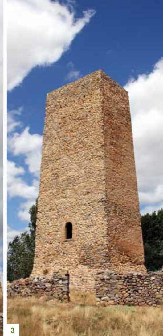
1. TORREÓN DE CASTELLANOS. 2. LA PICA O TORRE DE LOS SALVADORES. 3. TORREÓN DE MASEGOSO.