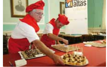
Presentación en el Casino.

El Taller de Empleo ha ocupado a ocho trabajadores, dos monitores y una directora que han recibido e im-