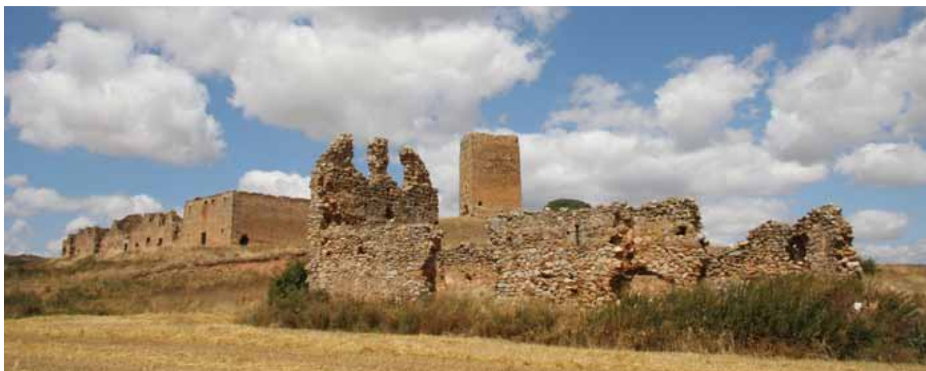
Palacios y Torre de Los Salvadores.

A menudo, los sorianos mostramos orgullosos los castillos y alcazabas que recuerdan el remoto medievo y las guerras entre musulmanes y cristianos. Sin embargo los torreones y las atalayas parecen arquitectura menor. No lo son, albergan historias increíbles y gracias a su recuperación en los últimos años, nos permiten llevar a cabo recorridos de lo más interesantes.