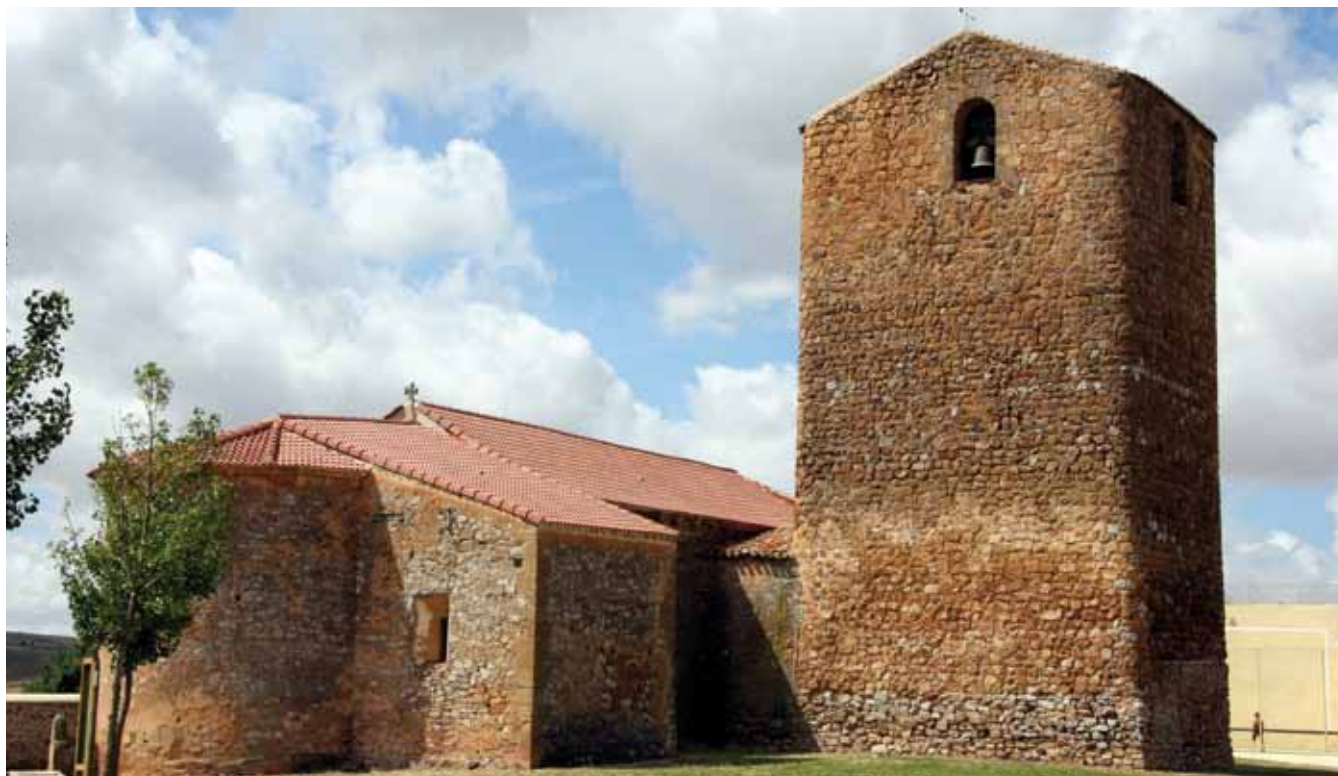
Iglesias y torreón de Aldealpozo.