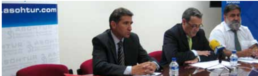
Un momento de la presentación en Soria de Sabores 2009.

Sabores 2009 inició los pasos para declarar Platos de Interés Turístico Regional a recetas destacadas de la región