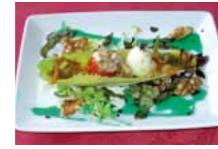
20. Hotel Leonor Barqueta de delicias de escabecha-do al aroma de tomillo