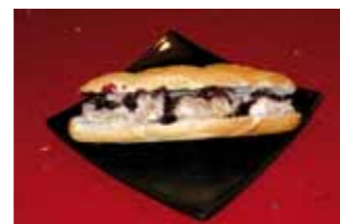
34. Taberna Capote Montadito silvestre de Liebre