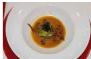
16. Chocolate a tres Hamburguesa de Faisán con rebozuelo