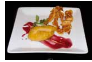
19. Garoa Restaurante Bocadito de Pechuga de Codorniz Rellena con Virutas de Torreznillo