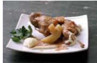
4. Bar Latino Escabeche de Codorniz