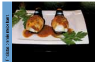
12. Avalon Huevos rellenos de ciervo con salsa estofada al tomillo