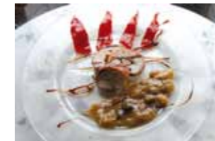
32. Taberna Cascante Conejo Campero trufado en su jugo