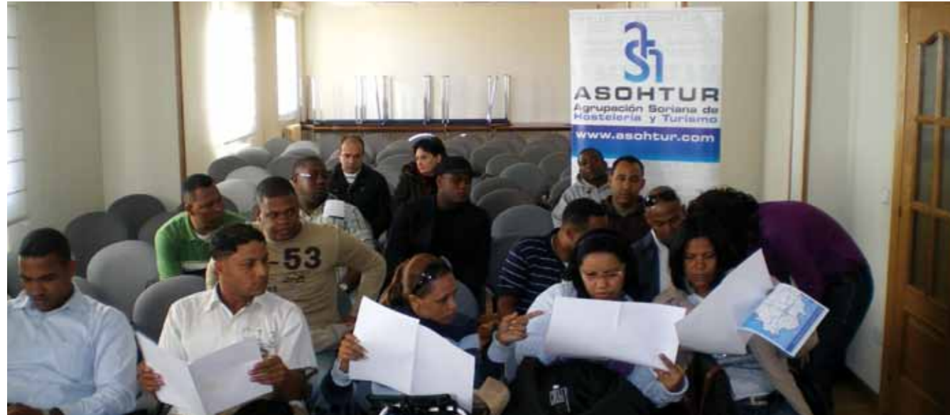
Trabajadores del contingente en su recepción en Foes.

14 camareros y 4 cocineros trabajan desde el pasado mes en los nueve establecimientos solicitantes