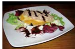
9. Café-Bar Soho Tosta de pato menier