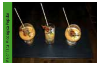
8. Casa Garrido Escabeche de Jabalí con salmorejo, crujiente de jamón y trufa negra de Soria