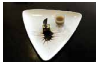
6. Bar Rte. Alcores Ravioli de calabacín relleno de pastel de Liebre, chupito de jugo de liebre y salsa de chocolate