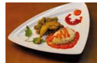
35. Tribeca Muslito de Codorniz con mousse de piquillo y caviar de berenjenas