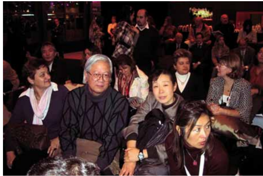
Representación internacional en la presentación de la trufa soriana.