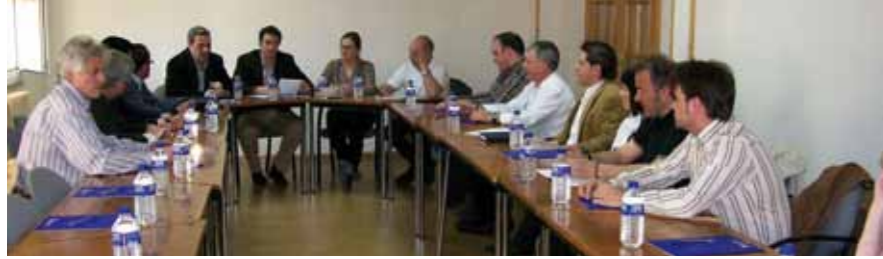
Reunión preparatoria de Asohtur de cara a Las Edades del Hombre

La muestra, que se desarrollará entre mayo y diciembre, ofrecerá 180 obras procedentes de todas las diócesis de la región