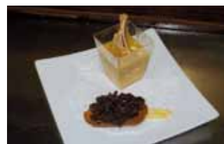
14. Cervecería El Templo La Cazuelita