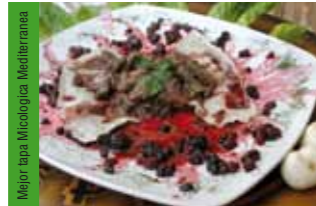
3. Bar Ferradores Delicias del Ciervo a los frutos del bosque