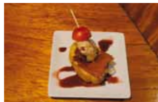
7. Bar Rte. El Portillo Pechuga de Codorniz escabechada con vinagre de manzana sobre tosta con compota de manzana