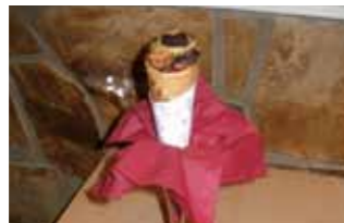
11. Café de San Blas Helado de invierno