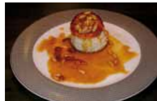
10. Café-Bar Rosel Volován relleno de Codorniz y Verduritas rociado con salsa de piñones