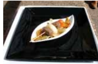
5. Bar Patata Brocheta de Jabalí escabechado con verduras