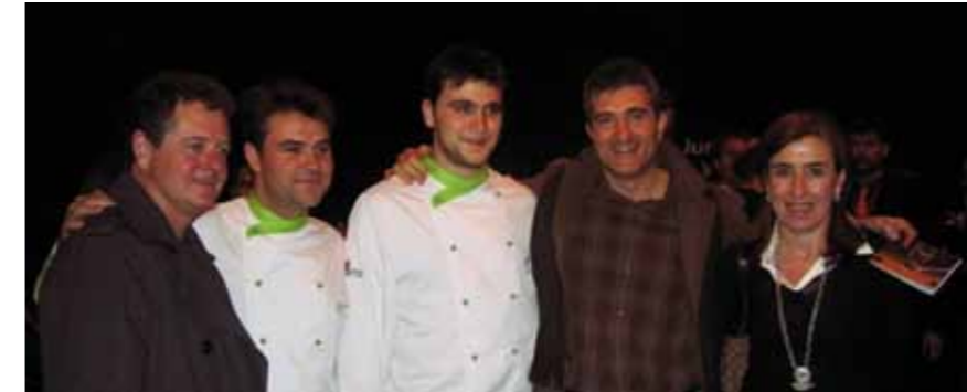
El dúo Gomaespuma acudió a la presentación.

En el marco que ofreció la última edición de la Feria Internacional de Turismo (Fitur) celebrada en Madrid, un grupo de restaurantes sorianos presentaron recetas con la trufa como ingrediente fundamental. Se trataba de promocionar un producto tan exquisito como desconocido para el gran público, que además tiene en Soria uno de sus principales centros productores. De esta manera, el Restaurante Maroto propuso el plato Sierra Cabrejas, a base de pan y torrenillo de Soria con