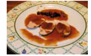
21. Hst. Rte. Don Jamón Jamón de Jabalí en su jugo