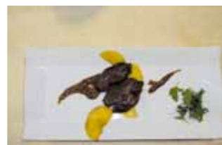
17. C.T.R. San Baudelio Liebre rellena al estilo Sanbaudelia