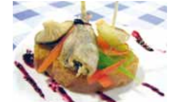
25. Meson las Ollerias (Deza) Delicia de Perdiz