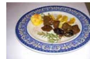
36. Bar Rte. El Ventorro Brocheta de corzo al aroma del monte, con manzana y ciruelas