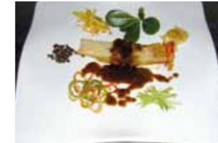
24. Mesón Castellano Cartucho de caza