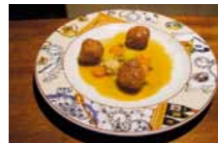
26. Rte La Posada Albóndigas trufadas de Ciervo