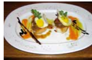
30. Rincón de San Juan Champiñón relleno de ciervo con sobrero de huevo de codorniz