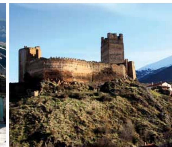
1. EL MONCAYO NEVADO. 2. PANORÁMICA DEL PUEBLO Y EL MONCAYO. 3. NACEDERO DEL QUEILES. 5. CALLEJUELAS DE VOZMEDIANO. 6. CASTILLO