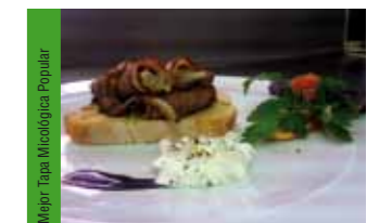
37. Los Villares CTR Civet caramelizado con espuma de patata y trufa