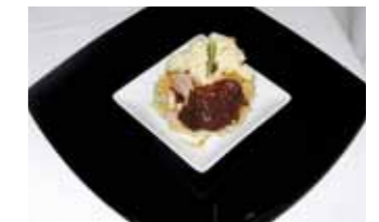
29. Rte. Santo Domingo Nido de Perdiz con mousse de trufa