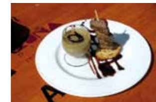
28. Rte. Iruña Plaza Brocheta de Ragut de Venado con su salsa y pan de pasas