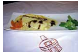
18. Fogón del Salvador Canel de caza con explosión de trufa