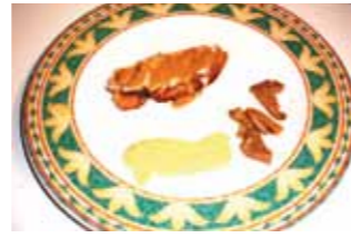
1. Bar Apolo Tosta de Perdiz con Alegrias