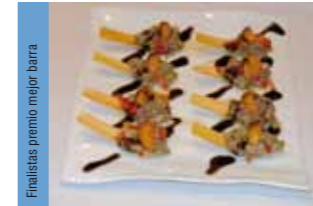
23. La Chistera Lomo de Jabalí escabechado con frutas