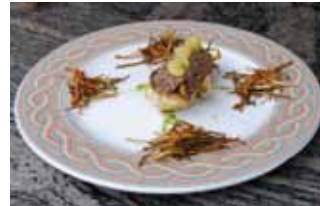
2. Bar Apolonia Lomo de Ciervo con sorpresa