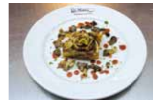
27. Restaurante Di Marco Solomillo de Jabalí crujiente