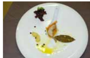
13. Alfonso VIII Zapatito de Codorniz