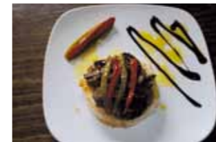
31. Taberna La Niña Suspiro Extremeño