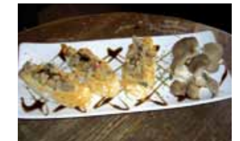
33. The Red Lion Delicia templada de Ciervo con setas del Moncayo