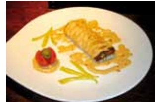
22. Kavanagh's Rollito de Ciervo Kavanagh's