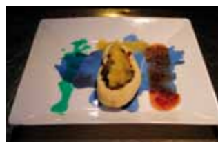
15. Cervecería Machado Ciervo estofado a la cerveza con compota de manzana