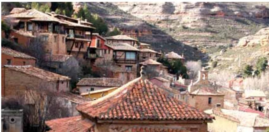
Somaén. Posada de Santa Quiteria.

Encinares, torreones y... una laguna caprichosa