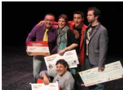
Ganadores de la octava edición del concurso de monólogos.

La octava edición del Concurso de Monólogos llevó al restaurante La Chistera el buen humor en lo que ya es una cita obligada durante los meses de febrero y marzo. Después de estos años, la cita a la que convoca el establecimiento de la calle Alberca se ha consolidado como uno de los mejores concursos de monólogos, gracias a su transparencia y acogida, tanto de la organización, como del público soriano. Así lo pueden avalar los participantes de ediciones anteriores. El atractivo de dicho concurso, consiste en representar los textos que resultan