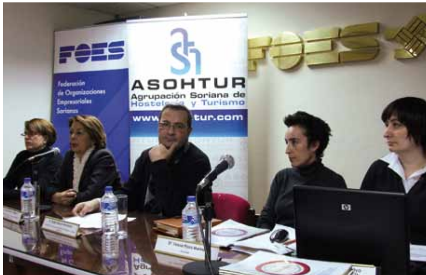
Un momento de la charla impartida en FOES.

Técnicos informaron a los profesionales sobre las obligaciones y responsabilidades que se derivan de la ley