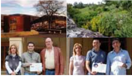
Dos fotos ganadoras y entrega de premios restaurante Alcores e Iruña.

Un nuevo reclamo turístico para la época invernal