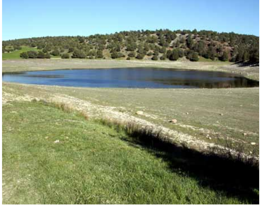
Laguna de Judes.