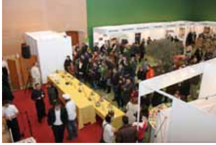
Público durante una charla sobre las virtudes de la trufa en la feria de Abejar.

Alfonso VIII celebró sus jornadas de la trufa de Abejar en colaboración con la Feria