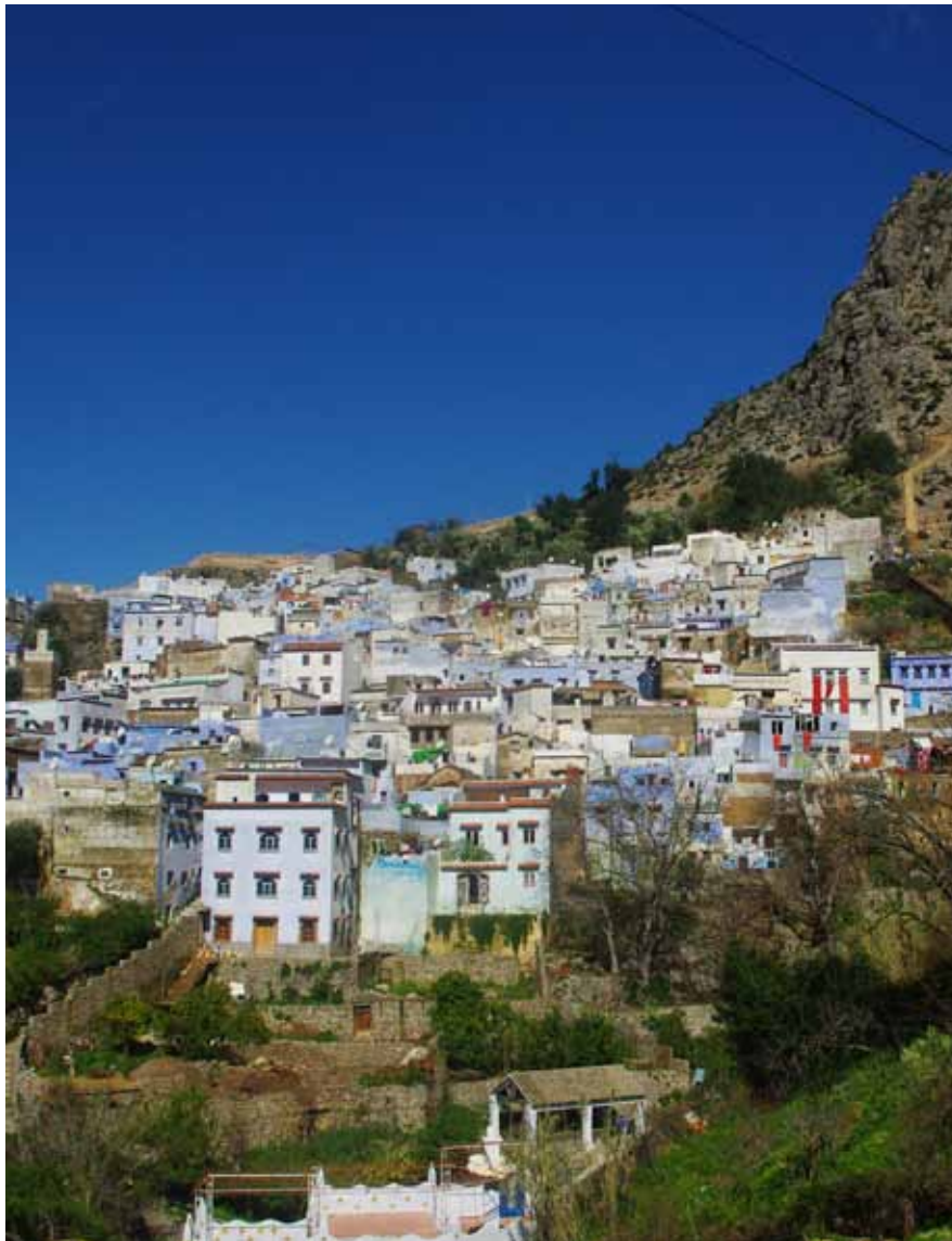
Vista de la ciudad marroquí donde se celebró el encuentro.

de la dieta mediterránea. El director de la Fundación Científica aprovechó para glosar las virtudes de la provincia, no sólo en materia gastronómica y de hábitos saludables, sino en fiestas, tradiciones y todo lo que tiene que ver con las actividades culturales y, sobre todo, patrimonio natural; todo esto tuvo una gran acogida en el encuentro. Fue el rey marroquí Mohamed VI el encargado de inaugurar las jornadas, y precisamente Soria la primera en mostrar sus virtudes.