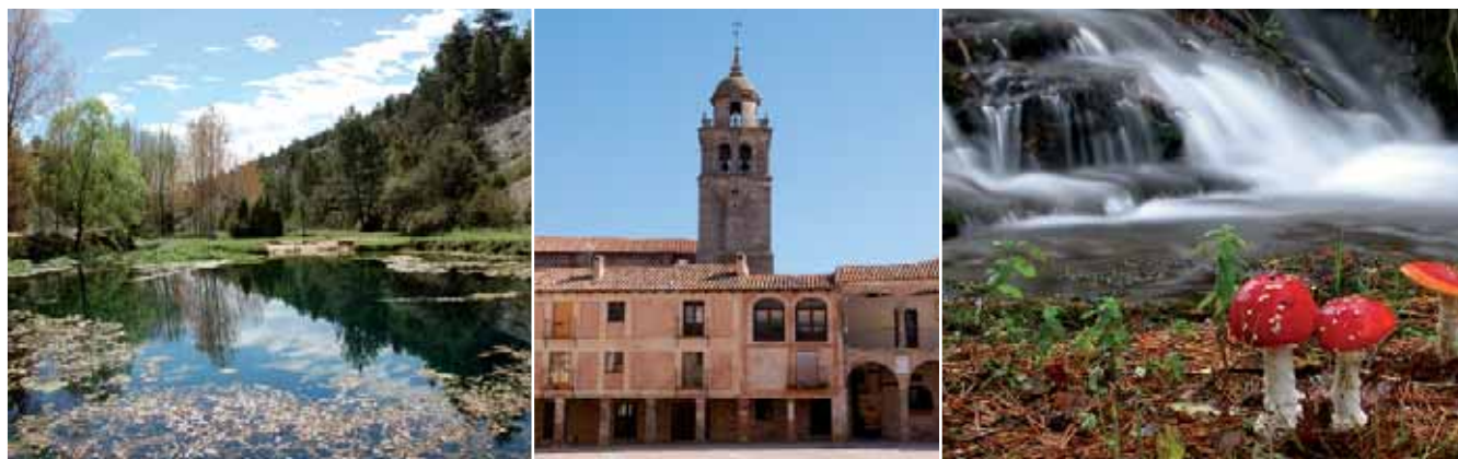
Naturaleza, Patrimonio Cultural y Micoturismo, piedras angulares de la promoción Turística de Soria.

Una cita que acoge diariamente más de sesenta mil personas, puede ser un punto de partida perfecto para comenzar a comercializar a modo de ensayo los primeros paquetes turísticos elaborados. La buena sintonía con las distintas instituciones que conforman el accionariado de Soria y Turismo, han contribuido a establecer lazos de colaboración con cada uno de ellos y en este caso concreto se ha establecido una estrecha línea de trabajo con el Ayuntamiento de Soria, al objeto de animar y dinamizar el pabellón que durante siete días se va a convertir en el gran escaparate de Soria. Efectivamente, entre el 29 de agosto y el 4 de septiembre Soria y Turismo, ha querido aprovechar este magnífico escaparate para ir a dar a conocer sus primeros productos turísticos y a establecer sus primeros acuerdos de comercialización. El objetivo principal es conseguir una cartera importante de potenciales clientes, que conozcan nuestros