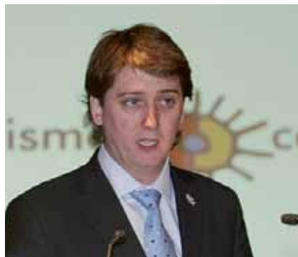
CARLOS MARTÍNEZ MINGUEZ VICESECRETARIO DE SORIA Y TURISMO ALCALDE DEL EXCMO. AYUNTAMIENTO DE SORIA

Indudablemente, sí. La materialización práctica de un proyecto tan ambicioso como éste, lleva detrás mucho trabajo y esfuerzo, pues a nadie se le escapa que poner de acuerdo a 150 accionistas en torno a un único objetivo, no es tarea fácil. Desde luego siento satisfacción, pero sobre todo orgullo al observar el compromiso y apuesta decidida de las empresas sorianas por Soria y Turismo, aun siendo consciente de que hasta el momento sólo disponemos del instrumento –que no es poco-. Ahora tenemos ante nosotros el reto apasionante de hacer de Soria un destino turístico de nivel, y todos los que hacemos Soria y Turismo debemos asumirlo como propio, aportando aquello que se espera de cada uno de nosotros.