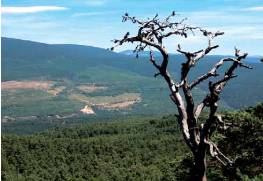
Camino de la "Andadera"