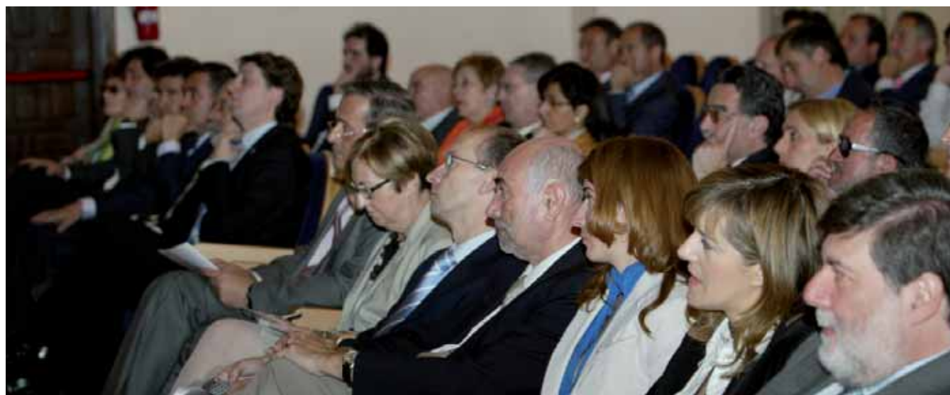
Los intervinientes disfrutaron de la representación de Tierraquemada.