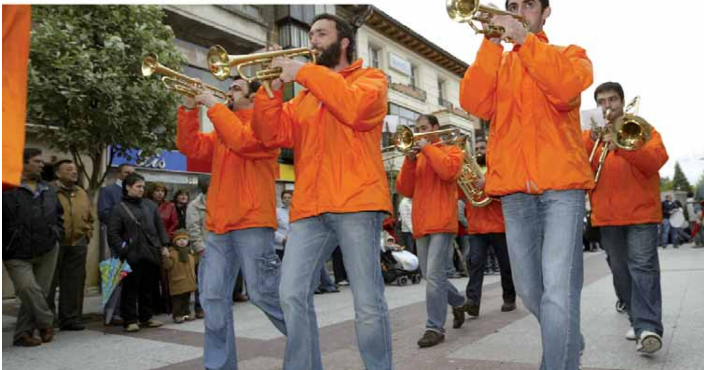
Las charangas recorrieron las principales calles de la ciudad impregnándolas de su música.

A las 8 de la tarde, los doce grupos fueron recibidos en el Ayuntamiento de Soria por el concejal de Cultura, Jesús Báñez, que agradeció a los participantes su presencia en la capital provincial y destacó su importancia en las diferentes fiestas que se celebran a lo largo del año en Soria, como las de San Juan, en junio, o las de San Saturio, en octubre. “Gracias a vuestra música y gracias a vuestra alegría que transmitís con este tipo de formación musical que se integra perfectamente con el pueblo, con la gente, en la fiesta, de tal manera que es una parte popular por excelencia en la celebración festiva”, afirmó el edil, que entregó sendas placas conmemorativas a las charangas.