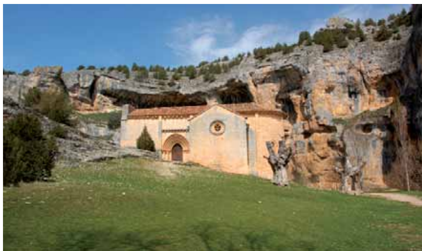
Ermita de San Baudelio en el Cañón del Río Lobos.

La riqueza medioambiental de Soria es indudable. La provincia tiene muchos rincones para descubrir, conocer y, por qué no, también disfrutar. Para ello, las empresas sorianas Soriaventura y Biosfera Soria se ponen a disposición de sorianos y forasteros para ofrecer diversas actividades al aire libre.