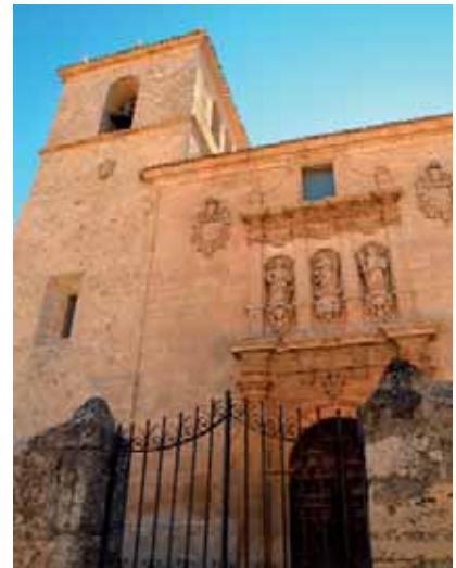
Iglesia parroquial de Abanco.