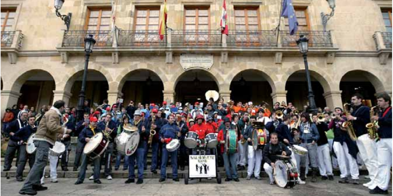
La plaza Mayor de Soria fue el punto de encuentro de las doce charangas.

Soria acogió, el segundo fin de semana de mayo, la 1ª Concentración de Charangas de Soria, evento organizado por la Agrupación Soriana de Hostelería y Turismo, ASOHTUR, y la charanga Palillera, de Gómara, y que contó con la presencia de 12 grupos, 10 sorianos y dos segovianos.