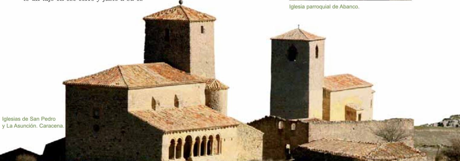
Iglesias de San Pedro y La Asunción. Caracena.