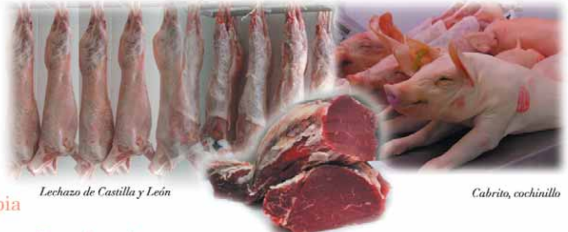
Lechazo de Castilla y León