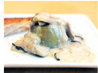
RESTAURANTE CASA GARRIDO Corazón de alcachofa