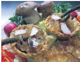
CAFETERÍA RESTAURANTE ALAMEDA Boleto