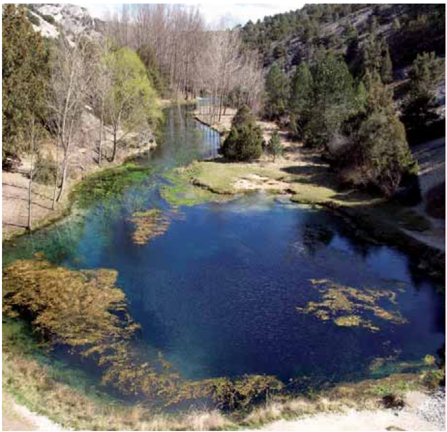
Nacimiento del Río Abián.

Nos vamos de la Fuentona de Muriel y, tras la visita, siempre recomendable al recientemente abierto Centro de Interpretación, muy cerca del pueblo y ya de camino a Calatañazor, hacemos parada en el sabinar. Por cierto que si nos llegamos a descuidar, hace veinte años lo talan para explotar la turbera sobre la que se asienta. Hoy es un paraje protegido y muy singular. Las sabinas son una especie que sólo pervive en algunos lugares de Francia, en el centro de la Península Ibérica y en el norte de Marruecos. Es una reliquia de