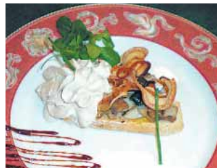
RESTAURANTE TIRSO DE MOLINA Crujiente y espuma