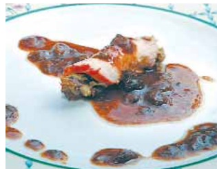
MESÓN DON JAMÓN Jamón edulis