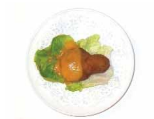
RESTAURANTE BAR COBIJO Seta de setas