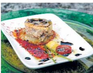
RESTAURANTE LA CASONA Flan de setas