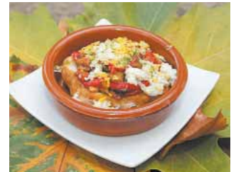
PUB THE RED LION Tostada de hongos