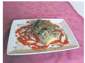
HOTEL LEONOR Tosta micológica