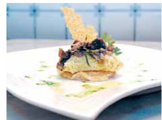
TABERNA CASCANTE Setas y bacalao