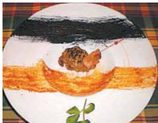
RESTAURANTE PEDRO Micológica