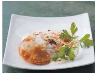
CAFÉ LATINO Medallón de champiñones