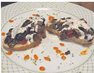
CASA APOLONIA Setas estofadas