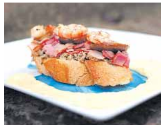
CERVECERIA MACHADO Tosta de malvasia