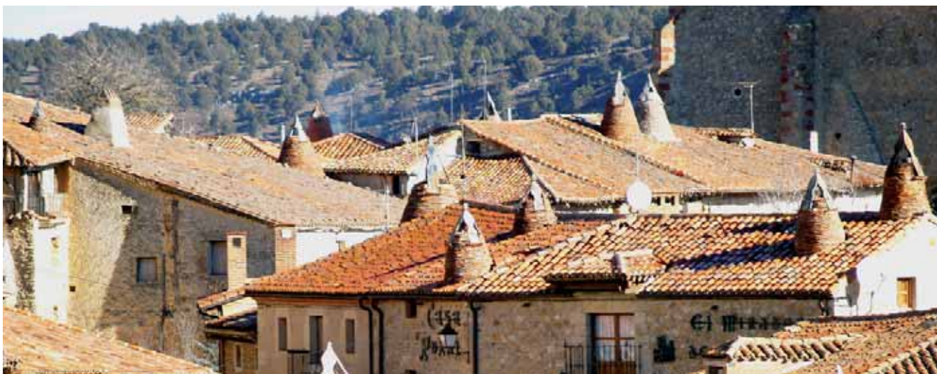
Tejados y típicas chimeneas.

Digamos que forman parte de la garnición de un plato principal pero que, en el caso del sabinar de Calatañazor son el ingrediente principal.