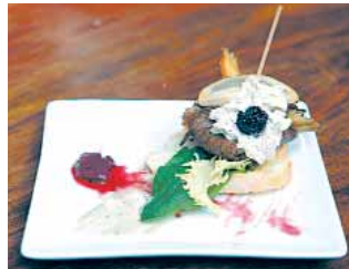
RESTAURANTE FOGÓN DEL SALVADOR Sinfonia de otoño