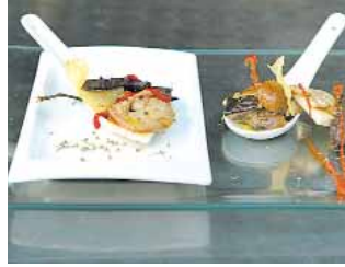
BAR RESTAURANTE PATATA Paseo por el bosque