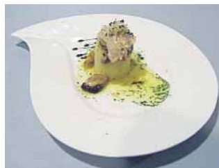
BAR RESTAURANTE YANTEA Cilindro de risotto