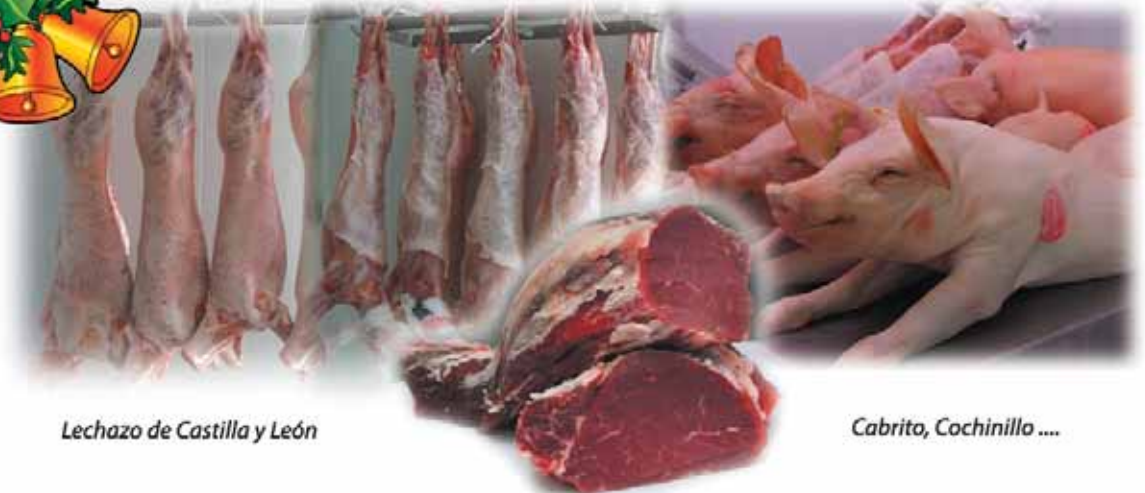
Lechazo de Castilla y León

EN SU MESA ESTA NAVIDAD... ¡¡¡ FELICES FIESTAS !!!