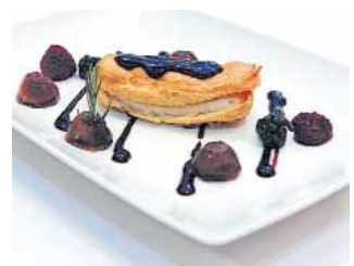
BAR RESTAURANTE EL VENTORRO Petit-Suisse de boletus y foie

6/08/08 HOSTELERÍA Y TURISMO EN SORIA REVISTA OFICIAL DE LA AGRUPACIÓN SORIANA DE HOSTELERÍA Y TURISMO www.soriaturismo.com