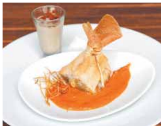
HOTEL VALONSADERO Pisto y crujiente