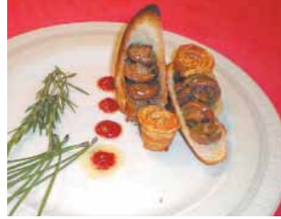
HOTEL RESTAURANTE ANTONIO Bosque en otoño