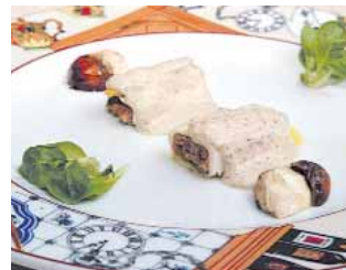
RESTAURANTE LA POSADA Caneloni e fungi