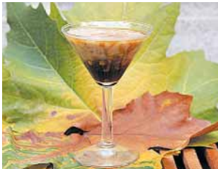
TABERNA CAPOTE Amontillado de hongos