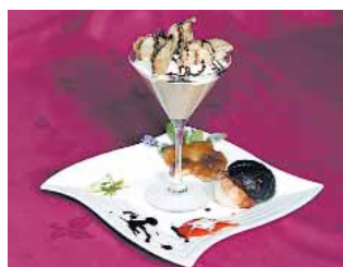
C. DE TURISMO RURAL LOS VILLARES Espuma