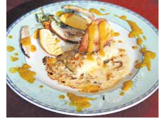
RESTAURANTE MAROTO Boletus parmesano