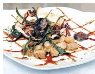
BAR RESTAURANTE HERRADORES Concha de boletus