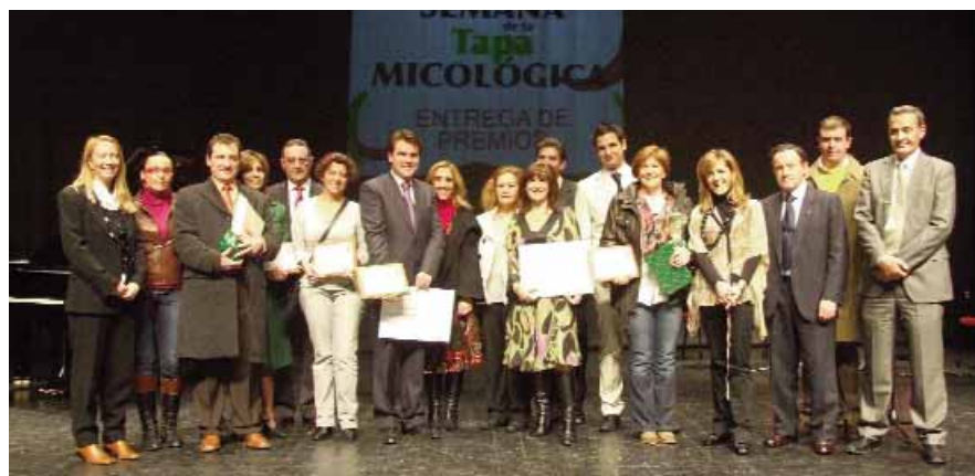
Foto de familia con los ganadores en las diferentes categorías del concurso de tapas micológicas.

El restaurante Trashumante se alzó con el primer premio de la Semana de la Tapa Micológica celebrada entre el 23 y el 30 de octubre y organizada por Asohtur y Soria y Turismo con motivo de la celebración del congreso internacional Soria Gastronómica. El resto de premios fueron a parar al restaurante Tirso de Molila de Almazán como mejor mostrador; el bar Herradores y el centro de turismo Los Villares por la mejor tapa micológica mediterránea, y Casa Garrido como la mejor tapa popular.