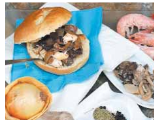
EL CAFÉ DE SAN BLAS Boina de escabechados