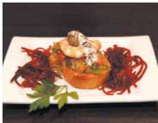
CAFÉ TEATRO AVALON Capricho de champiñón