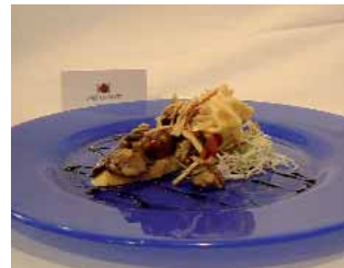
RESTAURANTE TRASHUMANTE Saludable