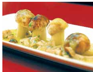
RESTAURANTE CHOCOLATE ATRES Rulo de bacalao