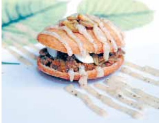
BAR KAVANAGH'S Tapa de champinones