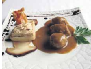
RESTAURANTE SANTO DOMINGO II Noquis de lansarones