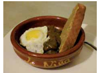
TABERNA LA NIÑA Secreto del Mediterráneo