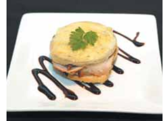
RESTAURANTE GAROA Delicia de berenjena