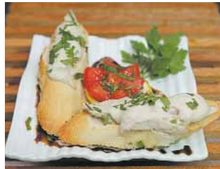
CAFÉ DEL ROSEL Tostada de pollo