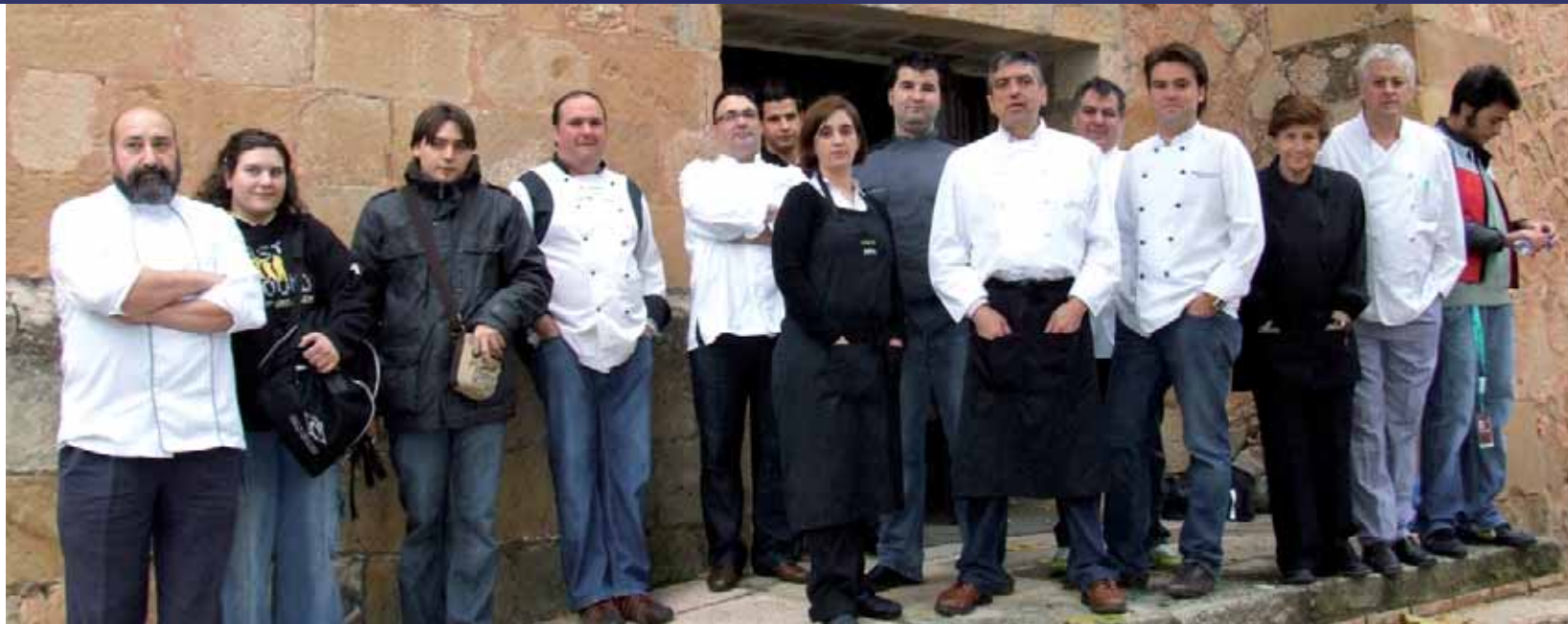
Participantes en el concurso de pinchos organizado por ASOHTUR.

La presencia de cocineros de nivel mundial, como Ferrán Adria, Juan Mari Arzak o Carme Ruscadella, otorgaron a la cita soriana una gran relevancia mediática