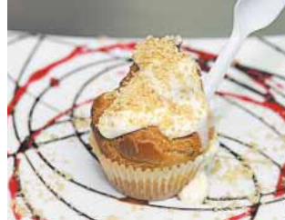
CERVECERÍA EL TEMPLO Volcán Choux