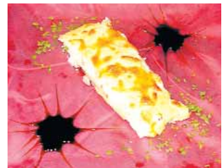
CAFETERÍA CAPITOL Tronco de setas