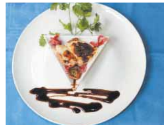
RESTAURANTE LA CHISTERA Niscalos gratinados