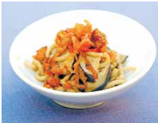
BAR RESTAURANTE IRUÑA PLAZA Fideua de hongos