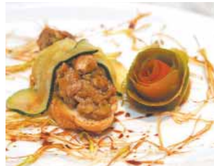
HOTEL ALFONSO VIII Chuspi