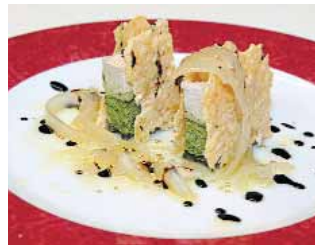
RESTAURANTE ALCORES Pastel tricolor